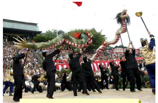
諏訪町の龍踊

今年の出し物は、新橋町の阿蘭陀万歳、諏訪町の龍踊り、 しぶ・ひきだんじり 新大工町の詩舞・曳壇尻、金屋町の本踊、榎津町の川船、西 たいりょうまんいわいびすぶね 古川町の本踊・櫓太鼓、そして賑町の大漁万祝恵美須船といった7ヶ町の踊りが披露されました。