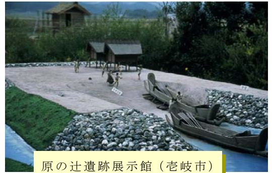
原の辻遺跡展示館(老崎市)

開催日時 10月19日(日) 13:00~14:30 会場 朝日カルチャーセンター大阪教室 (大阪市北区中之島 朝日新聞ビル5階) 受講料 2,000円