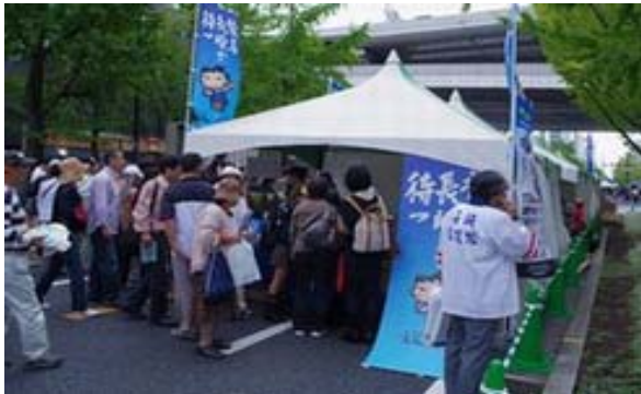
多くのお客様でにぎわう本県ブースの状況

去る10月11日、「御堂筋 Kappo (カップポ) 2009」と題するイベントに長崎県のブースを出展しました。このイベントは、大阪府が母体となった実行委員会が主催するイベントで、年に1回、大阪のメインストリートである御堂筋約1.9キロを歩行者天国にして、全国各地の物産展や街角コンサート、企業イベントのコーナーなど多彩な催しものが繰り広げられるイベントです。