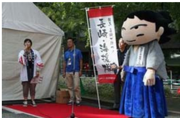
長崎県のPRタイムの状況です！！

読者の皆様におかれましても、引き続き、ご理解・ご協力方、よろしくお願い申し上げます。