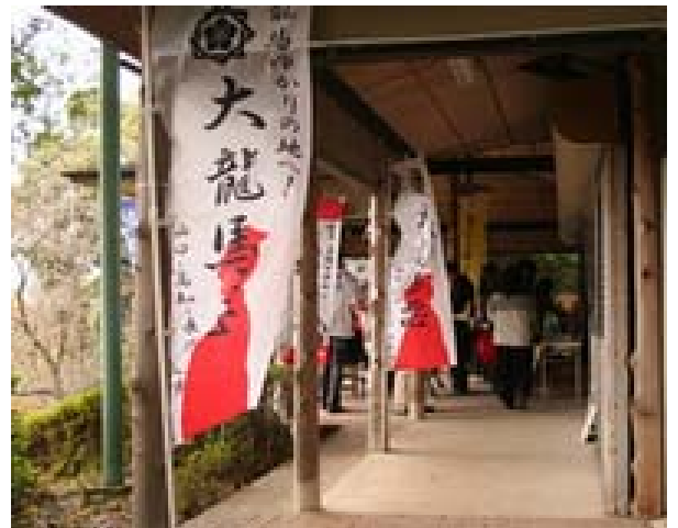
京都霊山護国神社会場（大龍馬恋の旗です。）

今回の商談会への地元からの出展業者は15業者（五島市8業者、新上五島町7業者）で、五島特産の海産物やかんころ餅、焼酎、五島うどん、あごだし、加工品などが他種類出品され、会場には関西地区の高級百貨店や大手スーパーなどのバイヤーをはじめ、約200名が来場する賑わいぶり、各ブースで商談に華が咲いておりました。