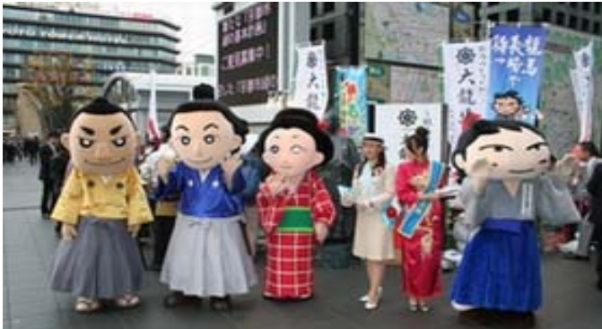
勢揃いした各県キャラクター及びミス（京都駅前広場）

◎龍馬ゆかりの4県（長崎・高知・山口・鹿児島）の大阪事務所が共同観光展を開催しました。