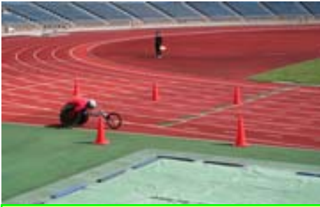
ゴール寸前の長崎県チーム

去る2月21日(日)京都市内で開催された全国車いす駅伝競争大会に参加する長崎県チームの応援に行ってきました。