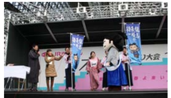
ステージ上の「龍馬の長崎」チーム

駆け上がり大会については、本県チームは「特別レース」として、坂本龍馬ゆかりの長崎県、高知県、下関市に加え、龍馬ファンで