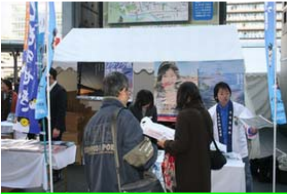
京都駅前広場での観光PRの様子です。

つくる京都、滋賀両府県の龍馬会など計8チーム各々が思い思いの格好で参加し、一般参加者が真剣に勝負する「本レース」とは異なるユーモラスなレース展開で会場を盛り上げました。